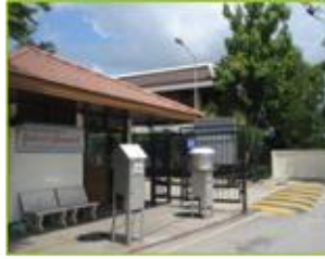
ตรวจฝุ่นรอบโรงงาน