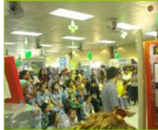
Safety Week 2009