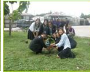
DRT ปลูกต้นไม้