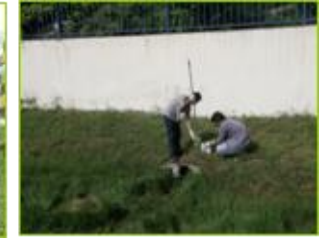
ตรวจวัดคุณภาพน้ำผิวดินรอบโรงงาน

ถือเป็นความรับผิดชอบในการดำเนินธุรกิจที่ต้องรับผิดชอบต่อสิ่งแวดล้อมและทรัพยากรชุมชน จึงให้ความสำคัญกับการควบคุมระบบสิ่งแวดล้อมในกระบวนการผลิต ซึ่งในปีที่ผ่านมาได้ดำเนินการหลายด้านดังนี้