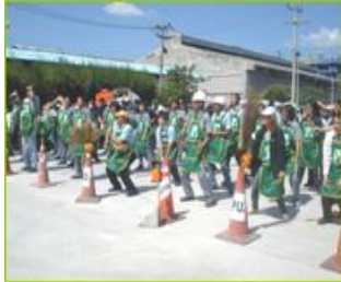
5ส Big Cleaning Day