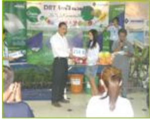
งานวันสิ่งแวดล้อมโลก