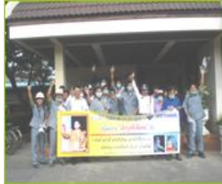
โครงการเลิกบุหรี่เพื่อพ่อ ปี 3