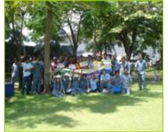
Safety Walk Rally 2009

บริษัทฯ ตระหนักถึงความสำคัญด้านความปลอดภัยในการทำงาน และมีความเชื่อว่าอุบัติเหตุ การบาดเจ็บ และโรคที่เกิดขึ้นจากการทำงานเป็นสิ่งที่สามารถป้องกันได้ด้วยความร่วมมือร่วมใจของทุกคนในองค์กร โดยปีที่ผ่านมา บริษัทฯ ได้ดำเนินงานเรื่องความปลอดภัยของพนักงาน ผู้รับเหมา และผู้มาเยือนอย่างต่อเนื่อง