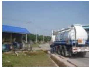
กำจัดกากอุตสาหกรรม