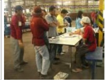
หน่วยบริการสุขภาพเคลื่อนที่

บริษัทฯ ตระหนักถึงความสำคัญด้านความปลอดภัยในการทำงาน และมีความเชื่อว่าอุบัติเหตุ การบาดเจ็บ และโรคที่เกิดขึ้นจากการทำงานเป็นเรื่องที่สามารถป้องกันได้ด้วยความร่วมมือร่วมใจของทุกคนในองค์กร โดยปีที่ผ่านมา บริษัทฯ ได้ดำเนินงานเรื่องความปลอดภัยของพนักงาน ผู้รับเหมา และผู้มาเยือนอย่างต่อเนื่อง