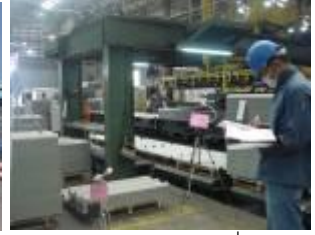
ตรวจวัดคุณภาพอากาศที่ทำงาน

ถือเป็นความรับผิดชอบในการดำเนินธุรกิจที่ต้องรับผิดชอบต่อสิ่งแวดล้อมและทรัพยากรชุมชน จึงให้ความสำคัญกับการควบคุมระบบสิ่งแวดล้อมในกระบวนการผลิต ซึ่งในปีที่ผ่านมาได้ดำเนินการหลายด้านดังนี้