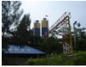
ตรวจวัดคุณภาพปล่อง