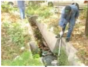
ตรวจวัดคุณภาพน้ำรอบโรงงาน