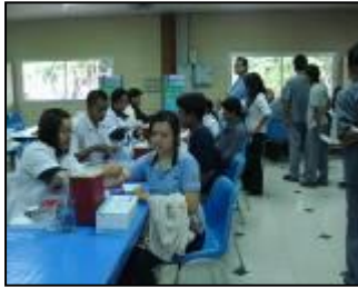
ตรวจสุขภาพประจำปี 2553