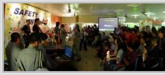
Safety Week 2010