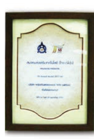
รางวัล 5S Award Model