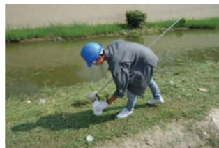
ตรวจวัดคุณภาพน้ำ