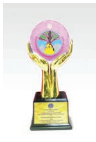
รางวัล สถานประกอบการ ดีเด่นด้าน แรงงานสัมพันธ์