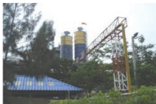
ตรวจวัดคุณภาพอากาศ