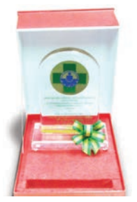
รางวัล สถานประกอบการ ดีเด่นด้าน ความปลอดภัย