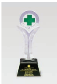
รางวัล Safety Award