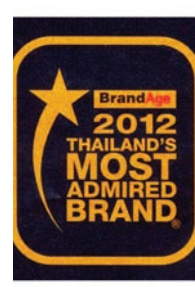
“ตราเพชร” เป็นแบรนด์กระเบื้อง มุงหลังคาในหมวด วัสดุก่อสร้าง ที่น่าเชื่อถือมากที่สุด