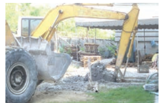
การกำจัดของเสีย