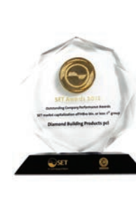
รางวัล ดีเด่นประเภท บริษัทจดทะเบียน ด้านผลการดำเนินงาน