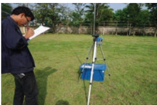
ตรวจวัดติดตามมลพิษ